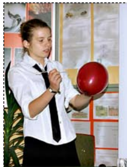
fot.: arch. Gimnazjum Raba Wyżna