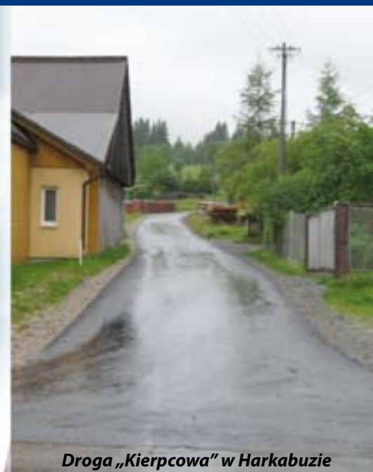
Droga „Kierpcowa” w Harkabuzie