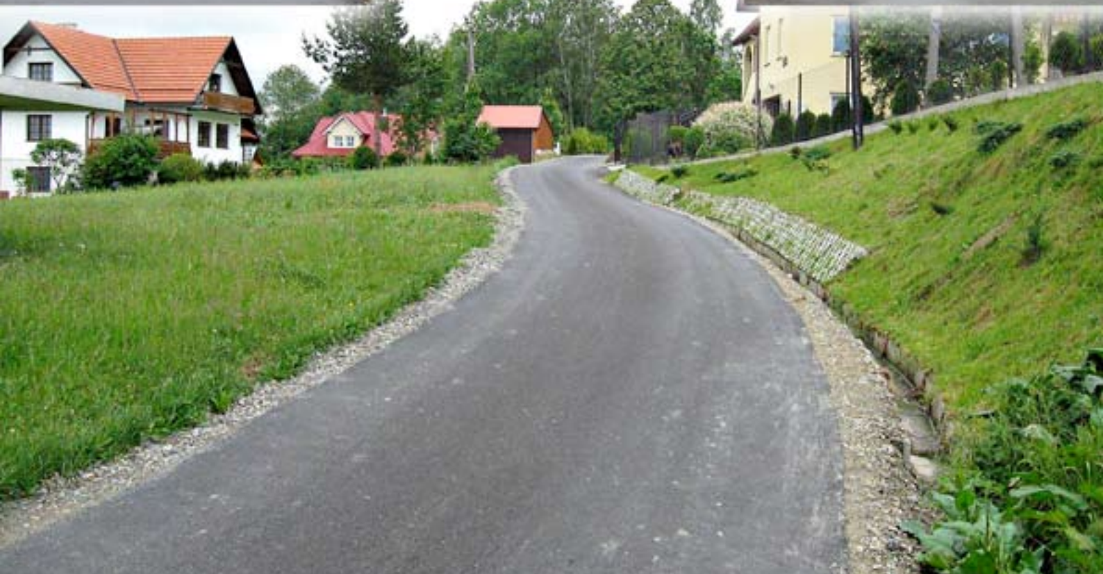
Droga „Wojtusiówka” w Rabie Wyżnej.