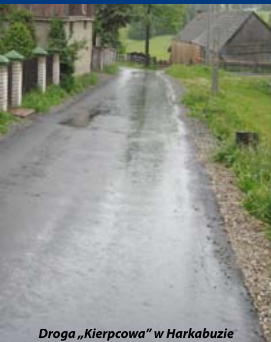
Droga „Kierpcowa” w Harkabuzie